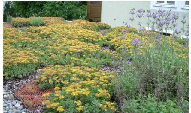
Optisch reizvoll und ökologisch sinnvoll – begrüntes Garagendach

Bei Dachbegrünungen reicht die Auswahl von einer 4 cm starken Extensivbegrünung mit Mauerpfefferarten, bis zu einer Intensivbegrünung mit Sträuchern und Bäumen. Meist kommt im Hausgarten eine Extensivbegrünung in Frage. Diese ist pflegeleicht, hält bis zu 60% des Regenwassers zurück , verbessert durch Verdunstung das Kleinklima und schafft neuen Lebensraum für viele Insektenarten. Gerade viele Garagendächer lassen sich auf diese Weise einfach begrünen, abzuklären ist vorher die Statik.