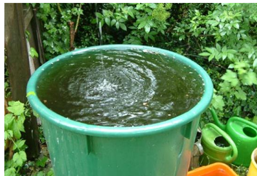
Die einfachste Möglichkeit zum Speichern von Regenwasser ist die Wassertonne

Wassertonnen sind die einfachste Lösung, hier wird Regenwasser gespeichert und nach und nach dem Garten zugeführt. Wassertonnen werden bei der Gebührenspaltung nicht berücksichtigt (keine Entnahme im Winter).