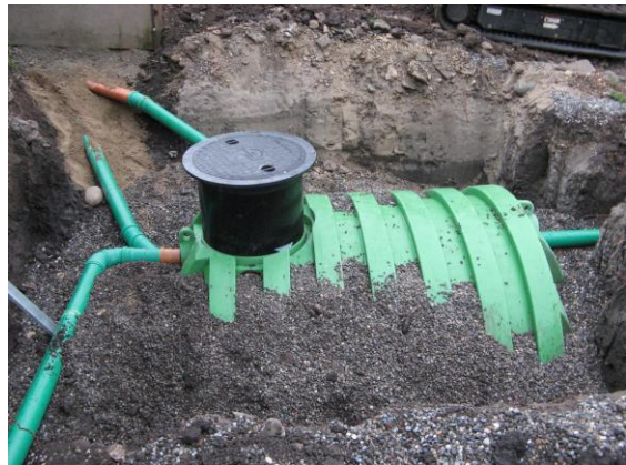
Einbau einer Zisterne

unter ‘Ökologie’ werden verschiedene Beispiele aufgezeigt.