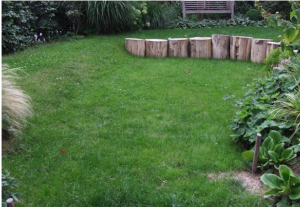
Rasenmulde als Sickerung im Hausgarten

Waschmaschine verwendet werden. Wie dann die anfallenden Abwasserkosten berechnet werden, ist je nach Kommune unterschiedlich geregelt.