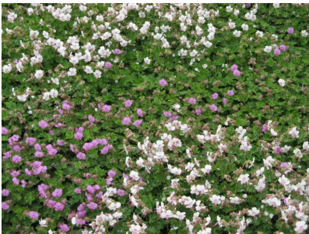
Storchschnabel (Geranium) als wüchsiger Flächendecker